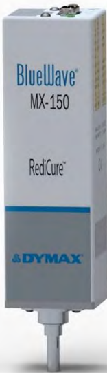
Abbildung 1. BlueWave MX-150 Strahler